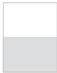
1/2 strony na spad 205x132,5 mm + 5 mm spad