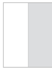
1/2 strony na spad 100,5x275 mm + 5 mm spad