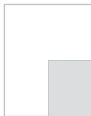
1/4 strony na spad 100,5x132,5 mm + 5 mm spad