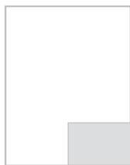
1/8 strony na spad 100,5x164,5 mm + 5 mm spad